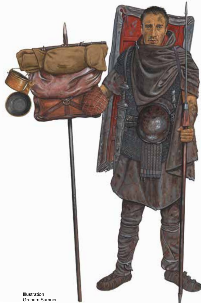
Illustration Graham Sumner

Antworten auf diese und weitere Fragen gibt die Sonderausstellung ROMS LEGIONEN. Detailgetreue Modelle mit Zinn-Legionären, großformatige Illustrationen und authentische Nachbildungen römischer Ausrüstung eröffnen facettenreiche Einblicke in die römische Armee und ihre Organisationsstruktur auf den Eroberungszügen zur Zeit um Christi Geburt.