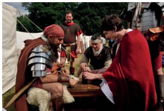
Abb 52: Römer- und Germanentage in Kalkriese