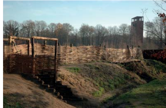
Abb 40: Museumspark