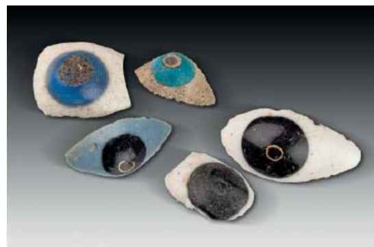
Abb 32: Glasaugen