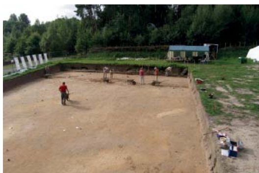
Abb 15: Ausgrabungen in Kalkriese