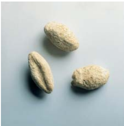
Abb 23: Schleuderbleie