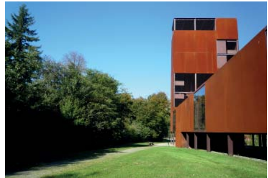
Abb 42: Museumspark