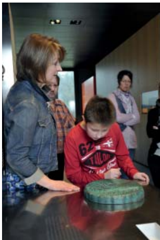
Abb 47: Familienführungen