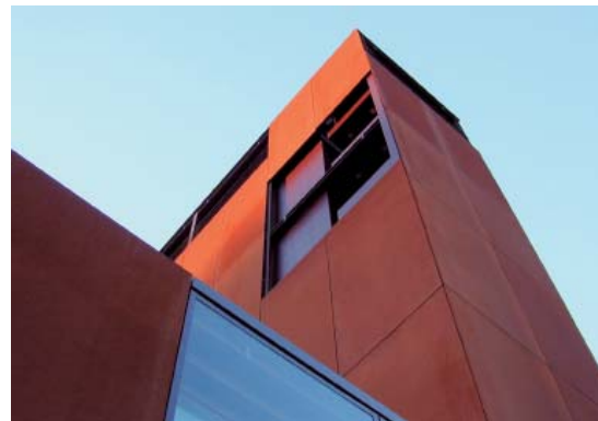
Abb: 36 Museum