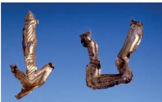
Abb 25: Zierbeschläge von römischem Militärschild