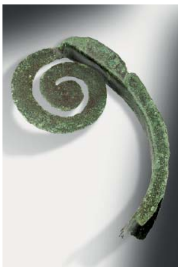
Abb 31: Spirale eines Lituus