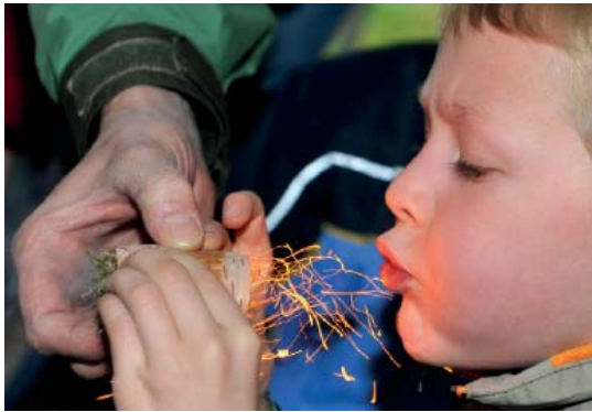
Abb 45: Ein feuriges Erlebnis