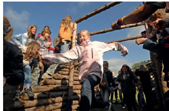
Abb 48: Auf den Spuren von Römern und Germanen