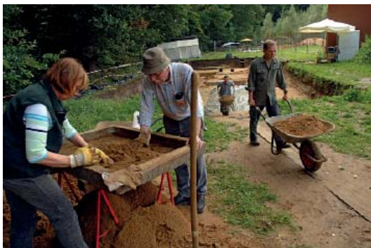
Abb 13: Ausgrabungen in Kalkriese