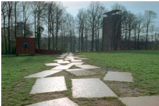
Abb 41: Der Weg der Römer