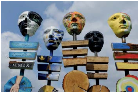
Abb 57: Aktion „Feldzeichen zu Friedenszeichen“