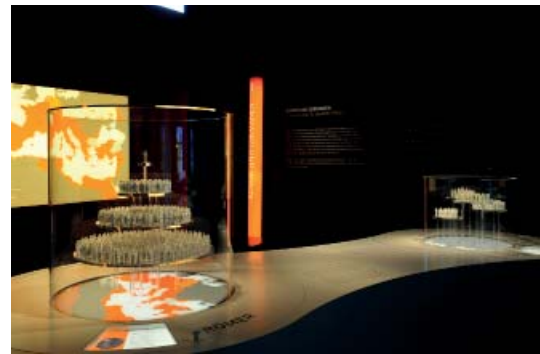
Abb 02: Römer und Germanen