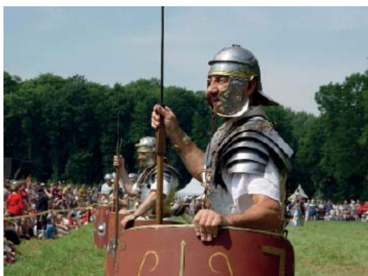
Abb 53: Römer- und Germanentage in Kalkriese