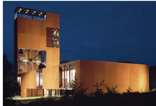
Abb 34: Museum bei Nacht