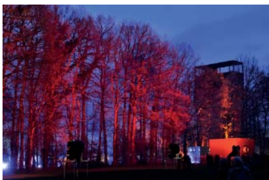
Abb 55: Oster-Leuchten in Kalkriese