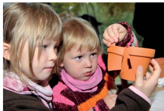
Abb 50: Archäologie für Kinder