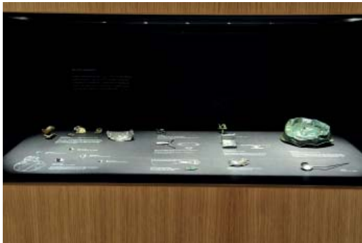
Abb 07: Fundstücke in der Ausstellung