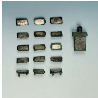
Abb 24: Metallbeschläge eines röm. Militärgürtels