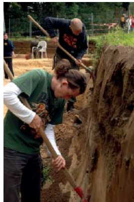
Abb 14: Ausgrabungen in Kalkriese