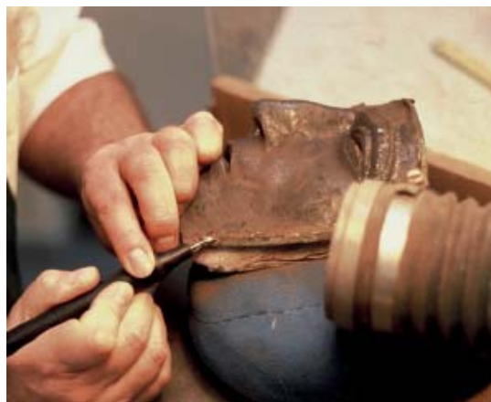
Abb 20: Die Maske beim Restaurator