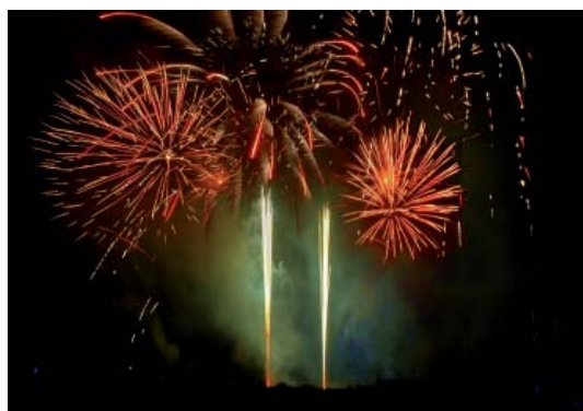
Abb 54: Oster-Leuchten in Kalkriese