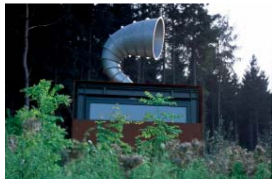
Abb 38: Pavillon des Hörens