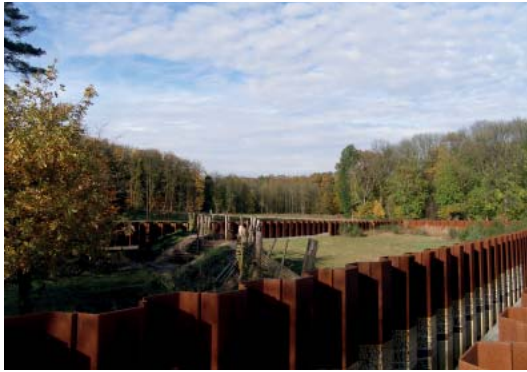
Abb 39: Museumspark