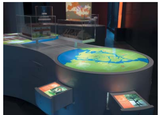
Abb 04: Lebensweisen der Römer und Germanen