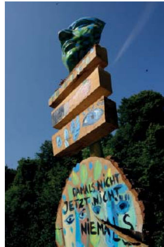
Abb 58: Aktion „Feldzeichen zu Friedenszeichen“