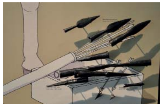
Abb 06: Wurflinzen und Pfeilspitzen