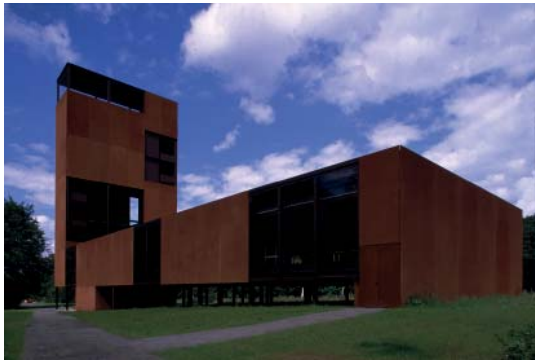
Abb 33: Museum