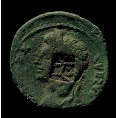
Abb 21: Münze mit dem Gegenstempel des Varus