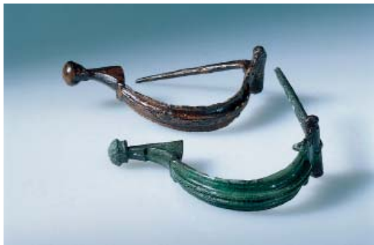
Abb 29: Zwei Fibeln vom Typ Aucissa