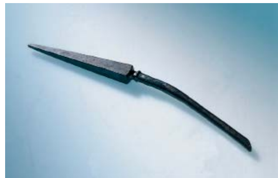
Abb 26: Spitze einer schweren Wurflanze (Pilum)