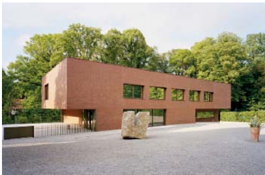
Abb 35: Besucherzentrum