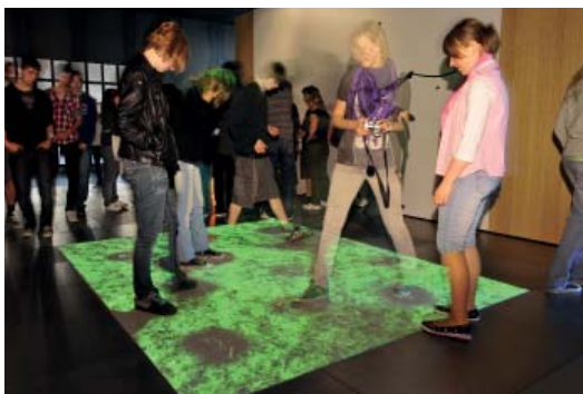
Abb 03: Spurensuche in der Ausstellung