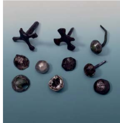
Abb 22: Diverse Nägel