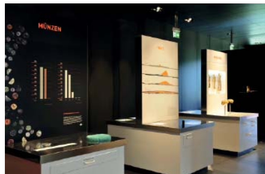
Abb 10: Indizien für die Varusschlacht