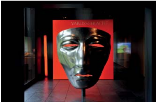
Abb 01: Auftritt der Dauerausstellung