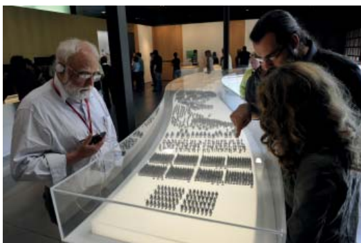
Abb 09: Der Zug der Legionen