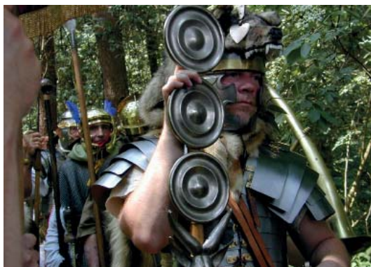
Abb 51: Römer- und Germanentage in Kalkriese