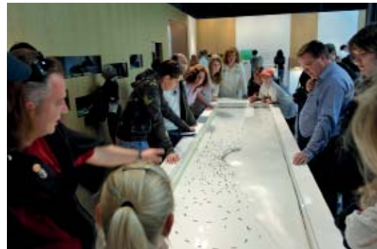
Abb 08: Das Kugelmodell