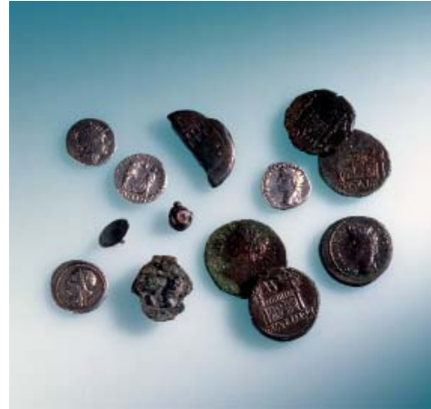
Abb 28: Inhalt der Geldbörse eines röm. Soldaten