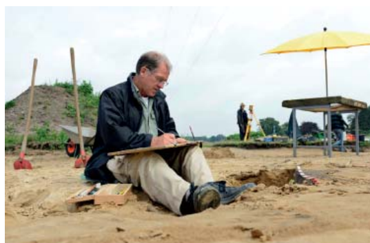
Abb 16: Ausgrabungen in Kalkriese