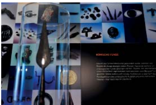
Abb 11: Römische Funde