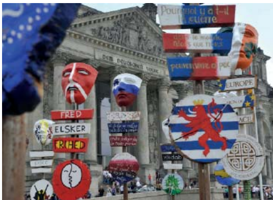
Abb 59: Friedenszeichen vor dem Reichstag