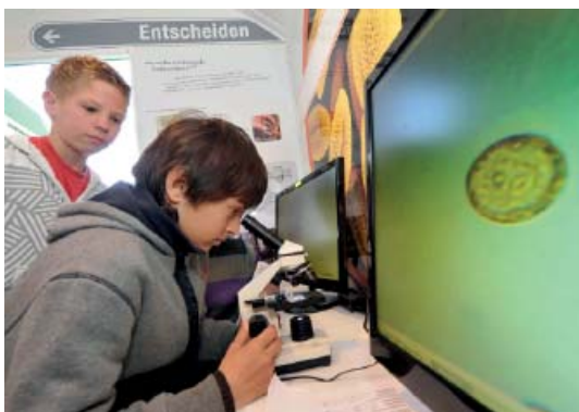
Abb 49: Forschen im Archäomobil