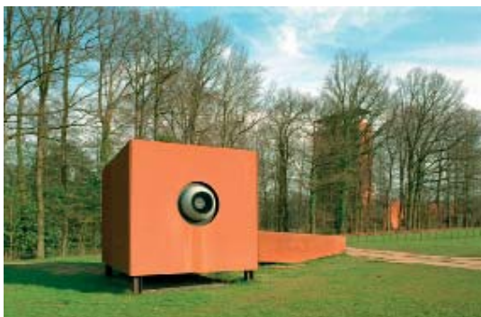
Abb 37: Pavillon des Sehens