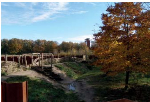
Abb 43: Museumspark