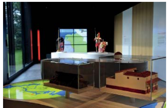
Abb 12: Das Leben vor 2000 Jahren