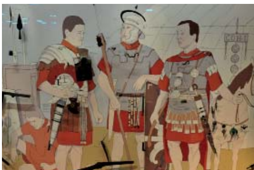
Abb 05: Römische Legionäre im Spiegel der Funde