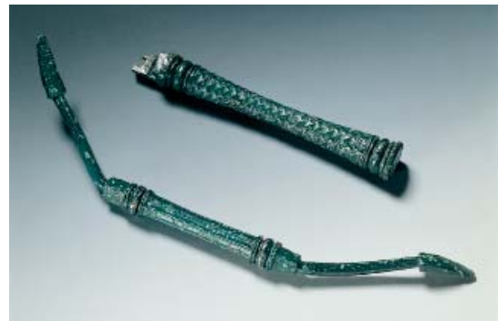
Abb 30: Knochenheber und Griff eines Skalpells