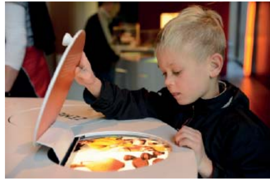
Abb 46: Familienführungen