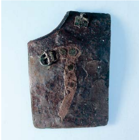
Abb 27: Brustplatte eines Schienenspanzers