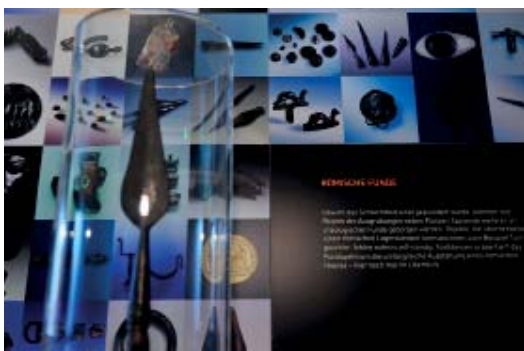
Abb 11: Römische Funde