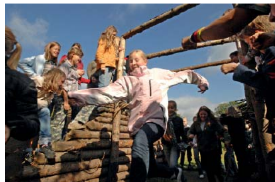
Abb 48: Auf den Spuren von Römern und Germanen